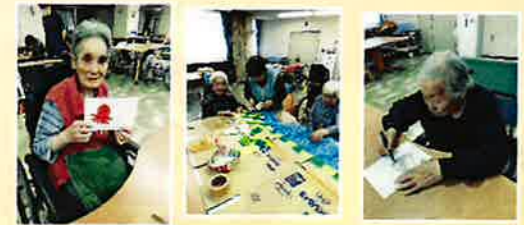
【作品作り頑張りました。】

「くらし展」の期間内に1日限定で喫茶店を開催しました。全フロアの入所者・利用者の方を対象にソーシャルディスタンスや時間調整をして、和セットと洋セットからお好きなセットを選んでいただき憩いの時間を過ごしていただきました。