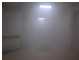
煙が充満した様子（訓練中）

半田消防署の立会の下、総合防災訓練を実施しました。ビデオ研修で炎と感知器の特性を学び、消火器及び消火栓の取扱訓練、煙を使用した夜間想定避難訓練を実施しました。避難後、消防車から2階まで消防士さんがホースを伸ばし、煙が漏れるドアと対峙した際は、本番さらなごの緊迫感あふれる訓練となりました。