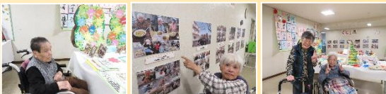
【作品を鑑賞しました。】

「くらし展」の初日には1日限定の喫茶店を開催しました。全フロアの入所者・利用者の方を対象に、感染対策や時間調整をして、和セットと洋セットからお好きなセットを選んでいただき憩いの時間を過ごしていただきました。