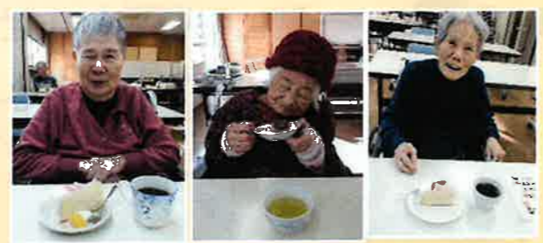
【笑顔でご来店されました】

毎年、入所者・利用者の皆さん及び施設職員が協力し、「くらし展」として作品展示や日常の写真展示を行います。作品は特養・養護・デイサービスの3施設が各々の特色を活かして、11月11日から23日の13日間展示し、コロナの影響により入所者・利用者の方に限定して、見学していただきました。