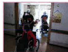
【総合防災訓練の様様】