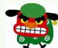
誠和荘神社は手作りです。